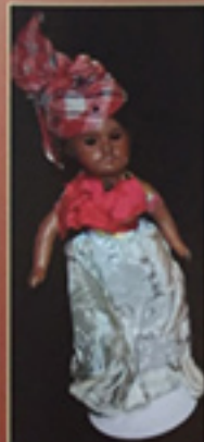
Links: Foto Debbie Behan Garrett, privé-collectie, donkere Unis France pop in de VS, Wikipedia

Deze poppen zijn hoogst zeldzaam: er bestaan waarschijnlijk nog minder dan 100 exemplaren. Je vindt ze vrijwel alleen in Amerikaanse musea.