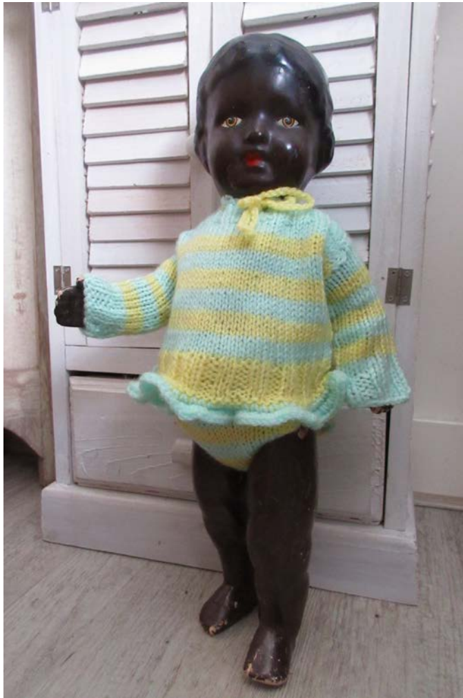
Photo: Composition Doll, mark Wildebras Netherlands, rare, 1950s, made with the same mold as their pink model (Private collection Jolie van der Klis)

In the 1960s, doll manufacturers developed more dolls in which every child could identify. Often that meant no more than just another colour of plastic in the same basic mold as that for pink dolls.