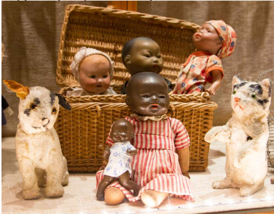
Photo: Dolls from different cultures and peoples, Ferrières doll-museum, Belgium (Jolie van der Klis)

European or black models. Such a rare model often comes with a hefty price, especially for the biscuit porcelain dolls.