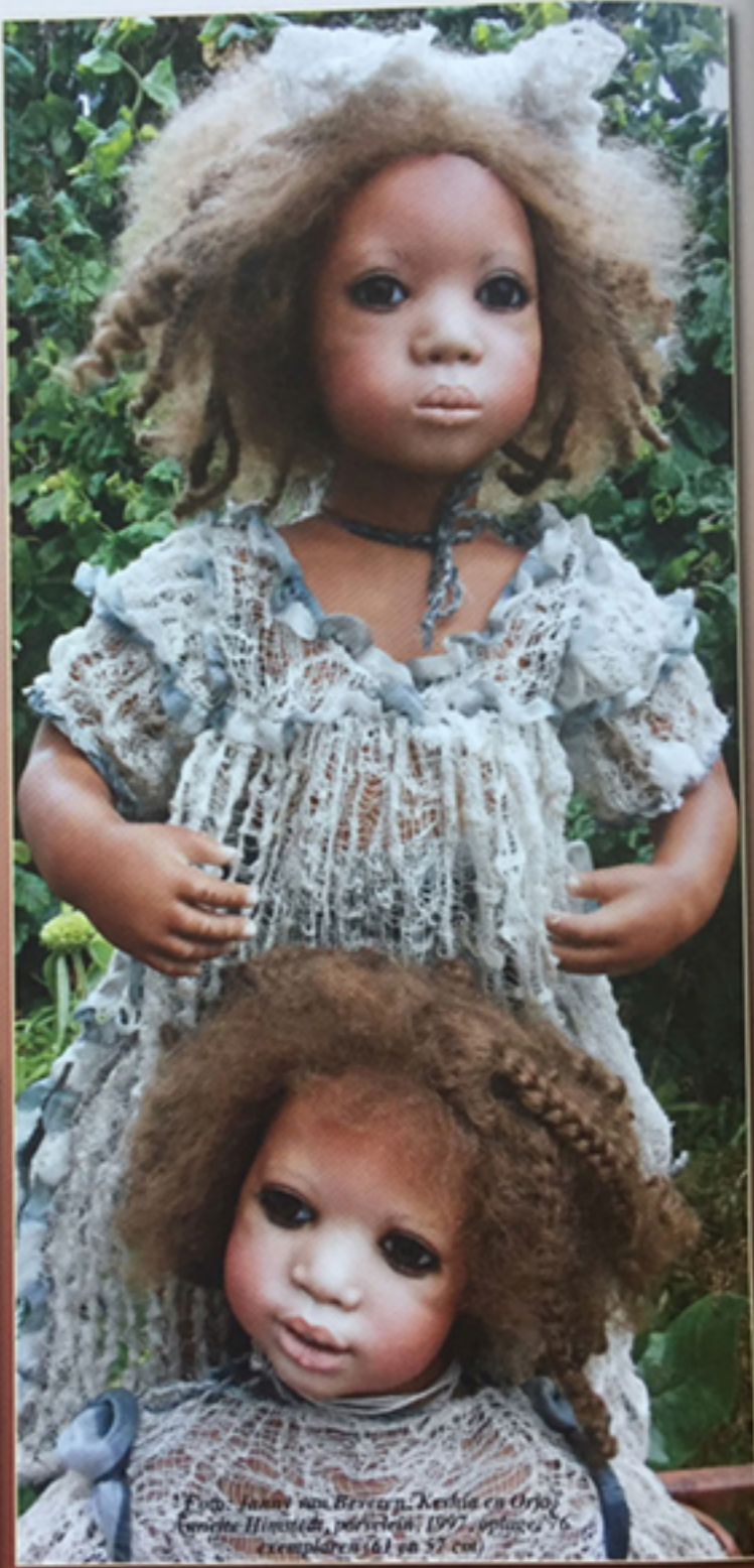
*Foto: Janny van Beveren. Keshia en Orja, Himstedt, porselein, 1997, oplage 56 exemplaren (51 en 57 cm).