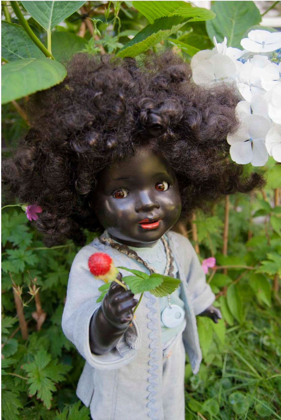
Photo: Keramische Werke Gräfenhain 134, 1932, with 'flirt/sleep eyes', left-right-looking (Private collection Jolie van der Klis)