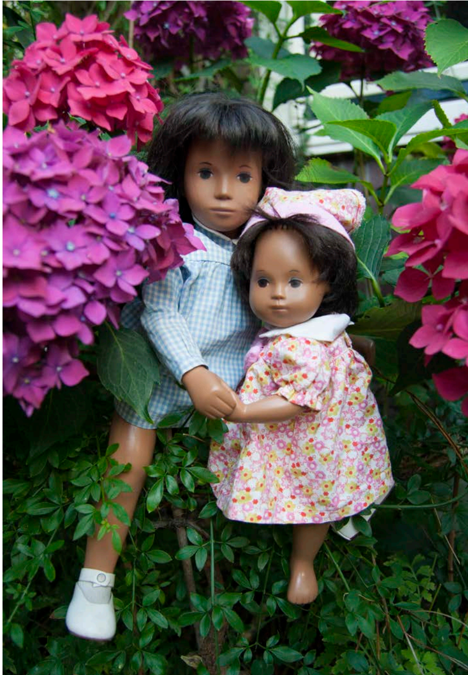
Photo: Sasha brunette in gingham (Trendon) and early girl baby doll (1970-1978)

In the early 1970s she added additional colour and hairstyle variation.