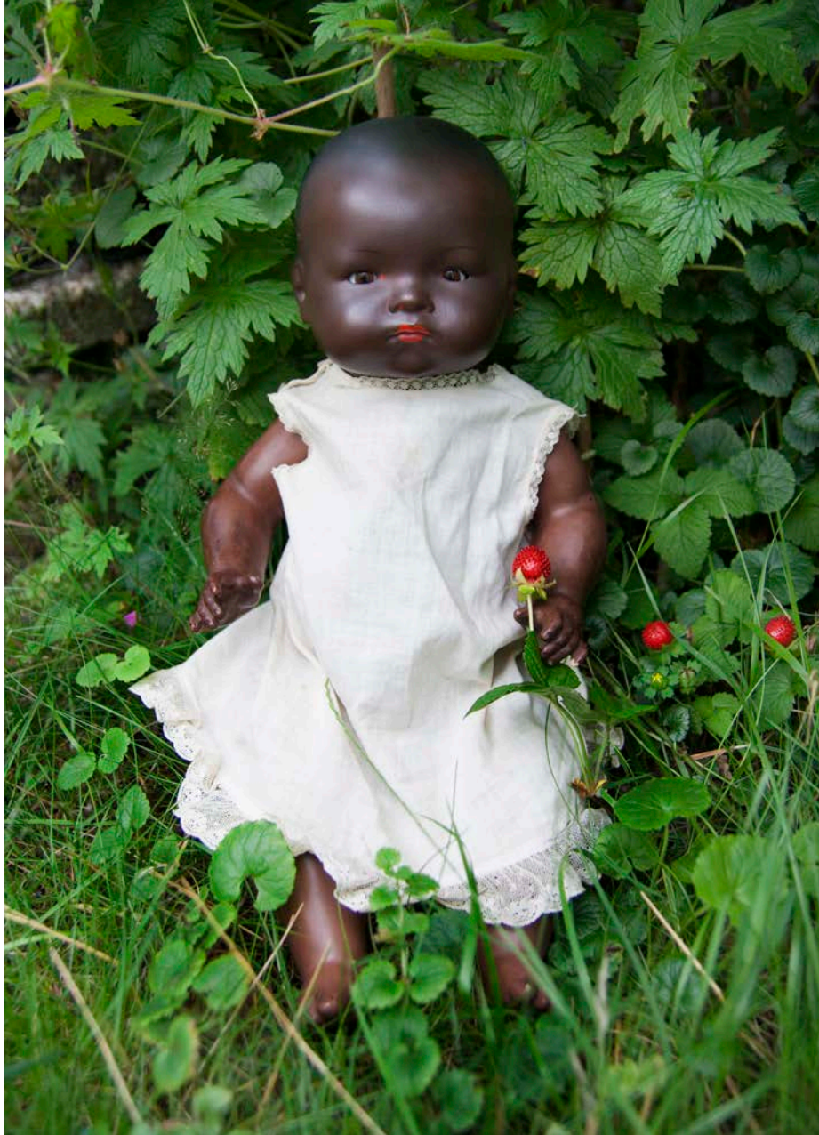
Photo: Dream Baby Armand Marseille Germany, 341 / 4K, 1926 (Private collection Jolie van der Klis)

Large doll-companies such as Jumeau, Heubach, Recknagel, Kestner, Simon & Halbig, Kämmer & Reinhardt, Armand Marseille brought beautiful 'exotic' (note: this word 'exotic' refers to the use of the word those days, literally meaning 'from an other country'; in most European languages the word 'exotic' is still used with its original literal meaning) dolls to the market. Often with a lot of attention for exotic (original foreign) clothing, silk kimonos, turbans, veils or chamois fringes. Sometimes simple or as clichéd as the peasant women on clogs: with only a few beads and raffia skirts.