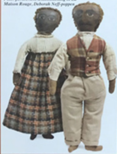
4. Poppen (rechts)

Foto: persbericht tentoonstelling in La Maison Rouge, Deborah Neff-poppen