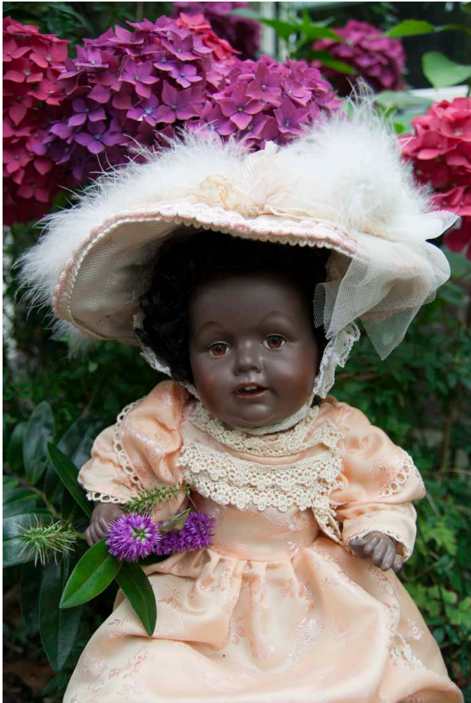
Photo: Kestner 247 Replica, 1985, all bisque (orig.: 1915) (Private collection Jolie van der Klis)