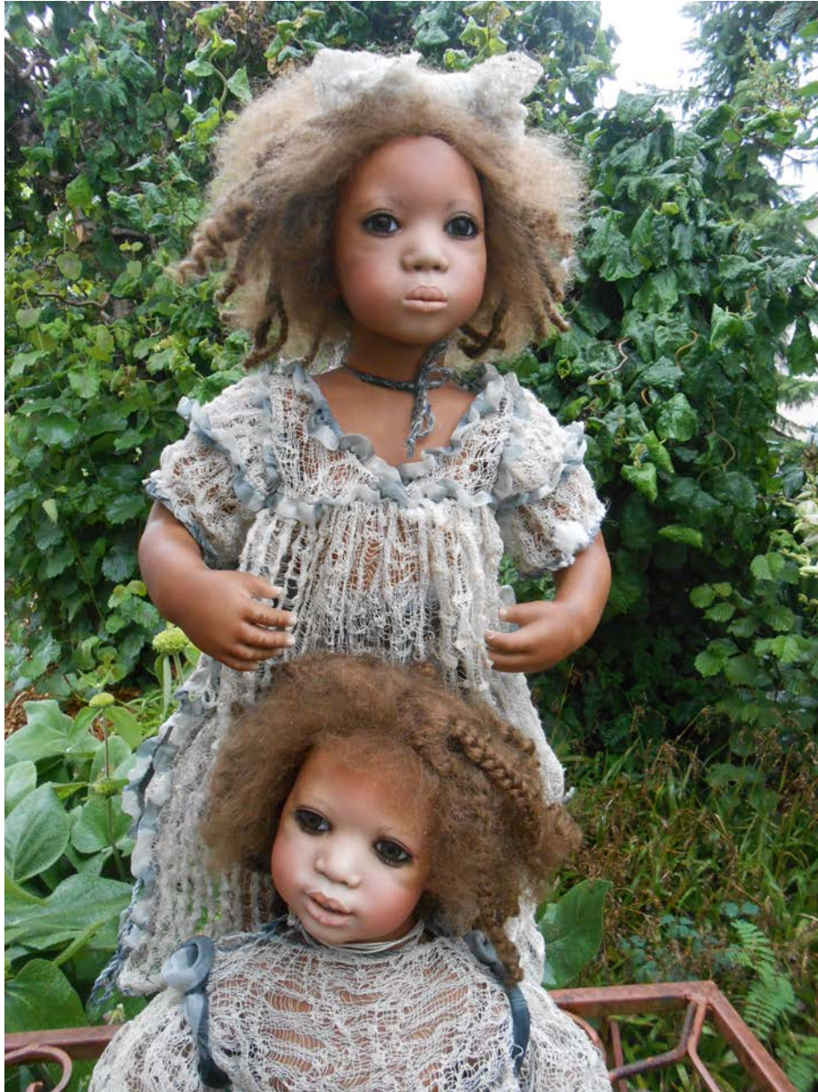
Keshia and Orja, Annette Himstedt, porcelain, 1997, edition: 76 copies (61 and 57 cm)

https://www.vogue.com/article/la-maison-rouge-black-dolls