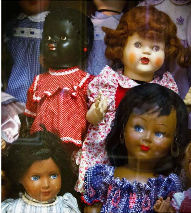
Photo: Fifties and sixties, including Italian dolls, Doll Museum Lisbon (Jolie van der Klis)